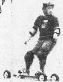
マウンテンボード